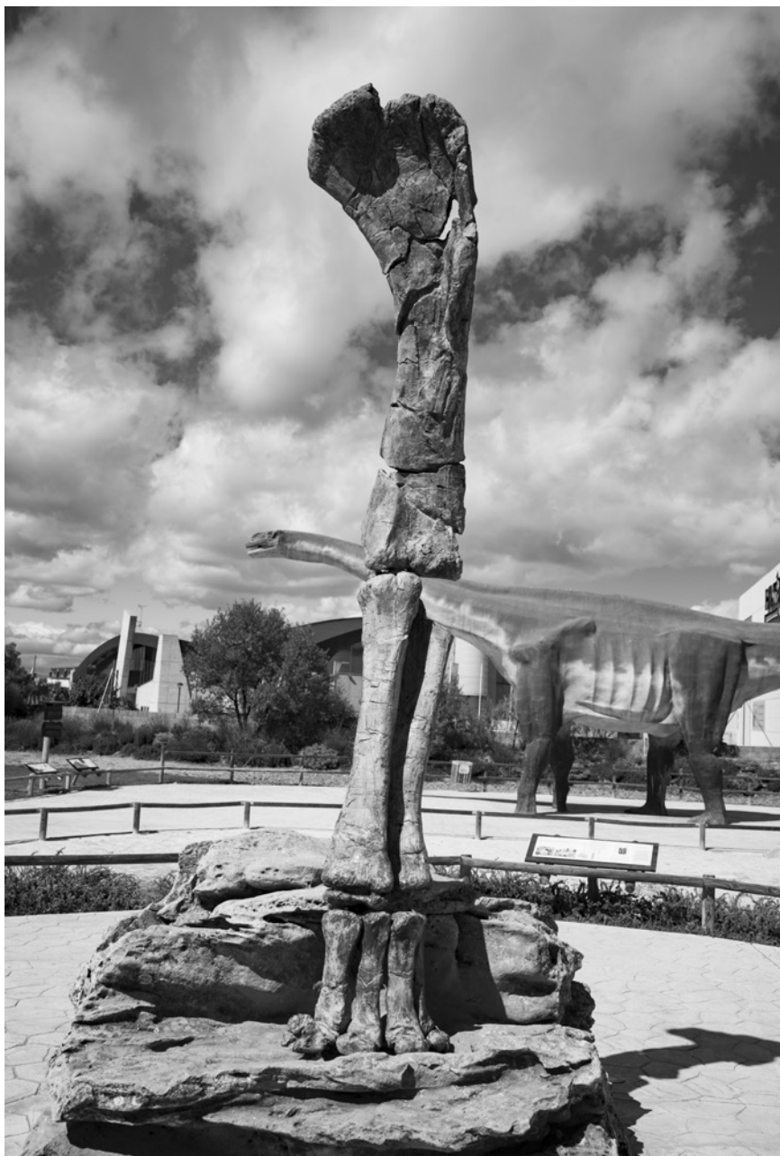
Joan Fontcuberta, Dinópolis, Teruel (2020), Dinosaur seriekoa