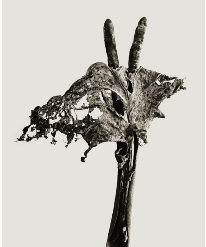
Joan Fontcuberta, Dendrita victoriosa (1982), Herbarium seriekoa

carceren [Kartzeren koadernoak] 1930ean idatzi bezala: «Mundu zaharra hiltzen ari da. Berria berandutzen ari da. Eta argi-ilun horretan munstroak sortzen dira». Argazki-gintza egiaren eta memoriaren promesa izatetik adimen artifizialaren bidez sortutako irudietara; dokumentutik espekulaziora; artista eta saiakeragileak azaleratzen ari diren munstrotasunak —hizkuntzarenak, teknologiarenak, politikarenak— erakusten ditu bere lanaren bitartez.