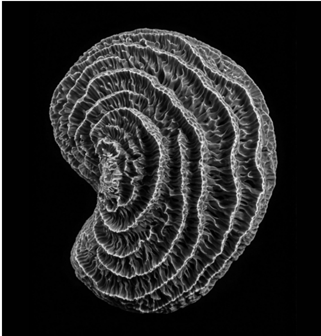
Joan Fontcuberta, Montipora aequituberculata (2024), What Darwin Missed seriekoa